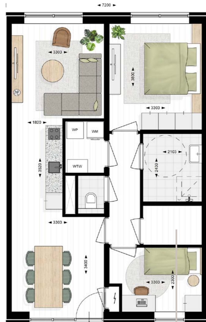
Nog efficiënter indelen levert extra bergruimte op!